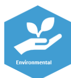
Diagrama 1: Aspectos clave de la sostenibilidad en el proceso de due diligence

Todas las inversiones en los segmentos de infraestructuras, private debt y private equity pretenden evitar los efectos negativos generales en relación con los riesgos de sostenibilidad a corto, medio y largo plazo sobre el medio ambiente, la sociedad y la gobernanza empresarial. En este caso, también se presta atención a los posibles riesgos de mercado, de liquidez o de reputación, así como a los riesgos operativos o estratégicos generales (minimización de riesgos). Además, YIELCO se esfuerza de forma proactiva por realizar inversiones específicas que cumplan con las normas de sostenibilidad generalmente aceptadas, teniendo en cuenta los aspectos de sostenibilidad o los factores ESG en el proceso de due diligence , con el fin de lograr la mejor rentabilidad posible ajustada al riesgo (optimización de la rentabilidad). El objetivo es un perfil de riesgo-rendimiento sostenible.