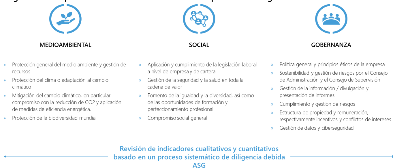
Diagram 1: Aspectos clave de la sostenibilidad en el proceso de diligencia debida